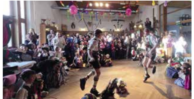
Viele Gruppen: Das Kinderhuttlerschaug'n.