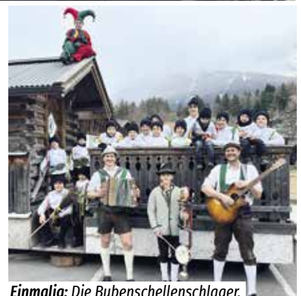
Einmalig: Die Bubenschellenschlager.