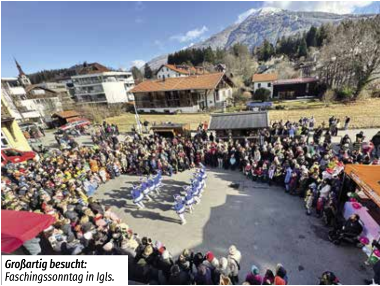
Großartig besucht: Faschingssonntag in Igls.

Auch der Nachwuchs stand im Mittelpunkt: Beim Kinderhuttlerschaug'n, Buabenschellenschlagen und der Kinderdisco begeisterten die jungen Mitglieder mit ihrer Freude am Brauchtum.