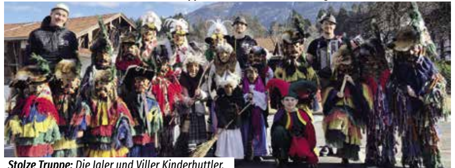
Stolze Truppe: Die Igler und Viller Kinderhuttler.