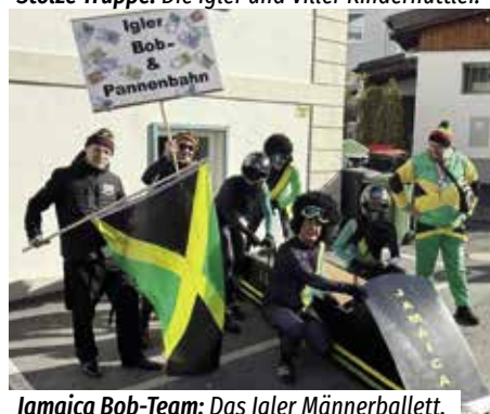
Jamaica Bob-Team: Das Igler Männerballett.