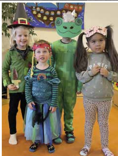
Bergweihnacht: Kindergarten-Engelschar. Nikolaus: Große Freude. Fasching: Farbe und Fröhlichkeit.