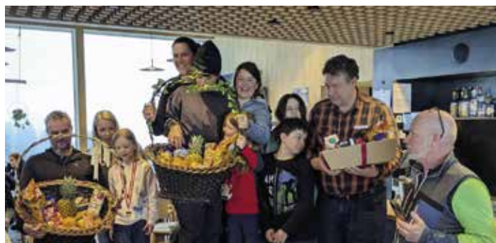
Gewinner: Die Vereinsmeister (links) und die schnellsten Iglener Familien.