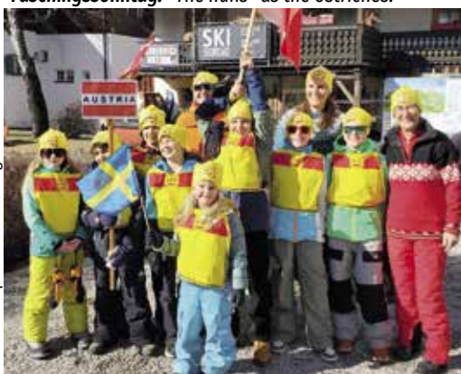
Faschingssonntag: 50 Jahre Olympische Spiele Innsbruck.