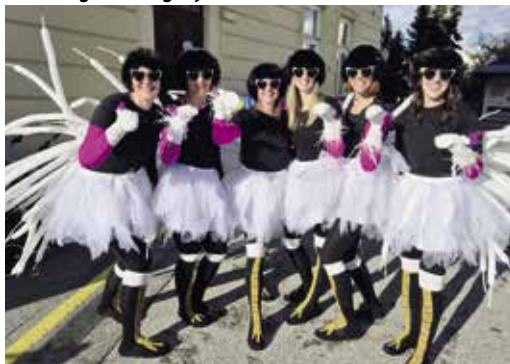
Faschingssonntag: "The nuns" as the ostriches.