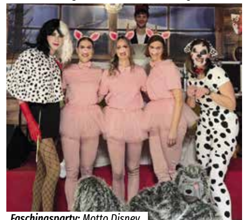
Faschingsparty: Motto Disney.