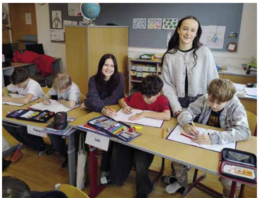
Faschingsspaß: Beliebte Kostüme (li oben). Fastenaktion: Der Schulbaum wird grün. Sozialwoche: Mithilfe in der eigenen Volksschule.